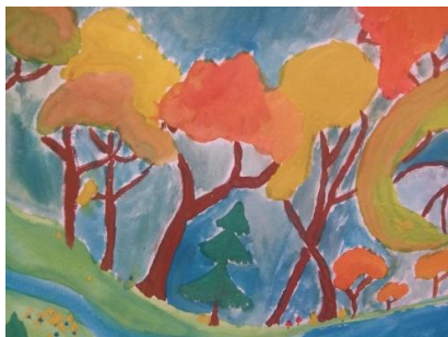
София Мингалёва 4а