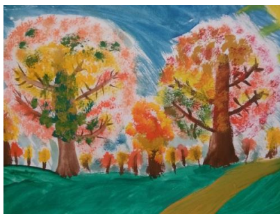
Агата Раманаскайте 4а

(Тенетник - это осенняя паутина, летающая по воздуху)